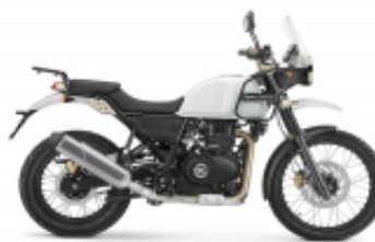
Himalayan 500 + $113.73