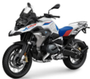
R 1250 GS Rally + $8,056.76