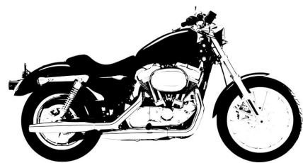
F 800 GS + $5,411.77