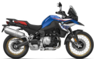
F 850 GS + $5,951.21