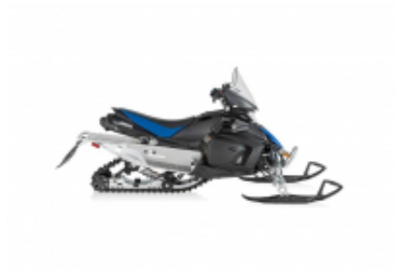
Viking 700 + $0.00