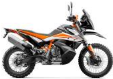
790 Adventure + $1,177.47