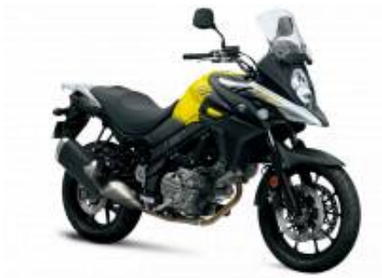
DL 650 V Strom + $0.00