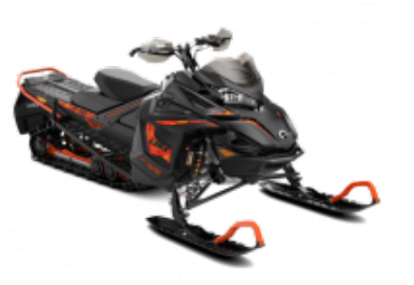
Lynx Xtrim 800 + $353.12