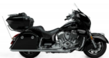
Roadmaster 1890 Grand Touring Class + $676.69