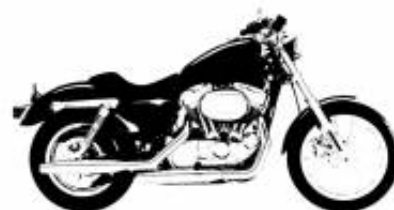
R 18 Transcontinental + $676.69