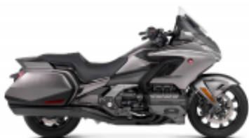
Goldwing DCT 2018 + $676.69