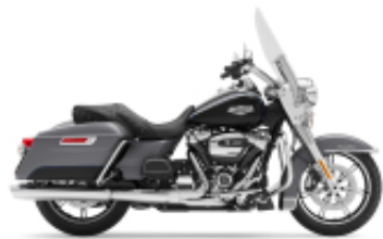
Road King Street Classic Class + $706.48