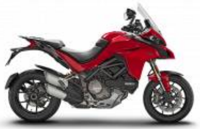
Multistrada 1260 + $588.74