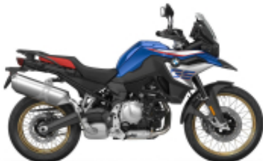
F 850 GS + $294.37