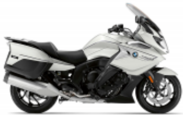
K 1600 GTL + $706.48