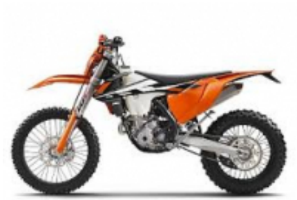
EXC 350 + $694.69