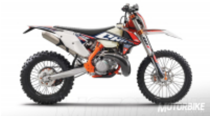
300 2T six days + $694.69