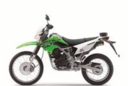
KLX 150 + $0.00