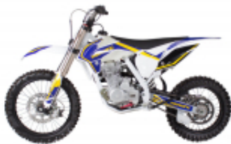
Wing 250 + $0.00