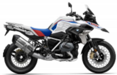
R 1250 GS + $671.69