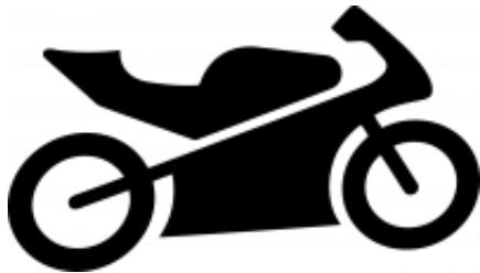
Mi moto + $0.00