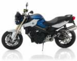
F 800 R + $707.05