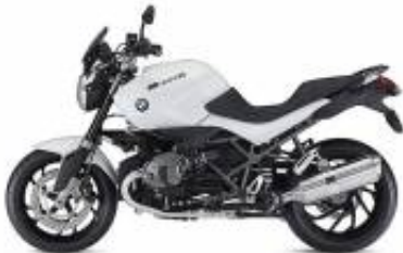
R 1200 R + $707.05