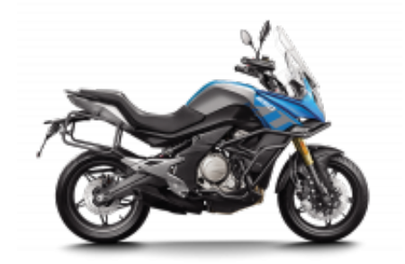
650MT 2022 + $1,201.85