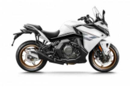
650GT + $1,201.85