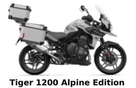
Tiger 1200 Alpine Edition + $2,295.66