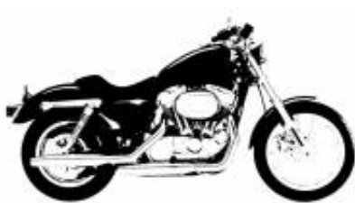
Mi moto + $0.00