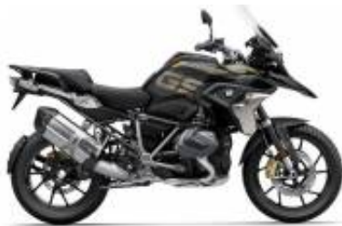
R 1250 GS LC + $190.00