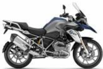
R 1200 GS + $150.00