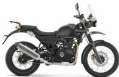
Himalayan 411 + 309,70 €