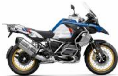
R 1250 GS Adv LC + $139.91