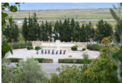
3 - Platamon - Lamía - 310