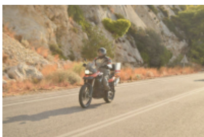
6 - Atenas - Patras - 226