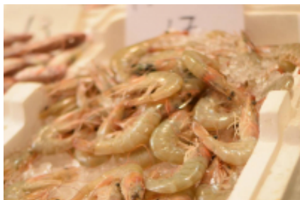
8 - Léucade - Ioánina - 225