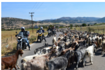
4 - Lamía - Atenas - 275