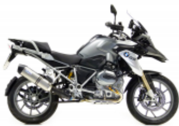
R 1200 GS LC + $669.41