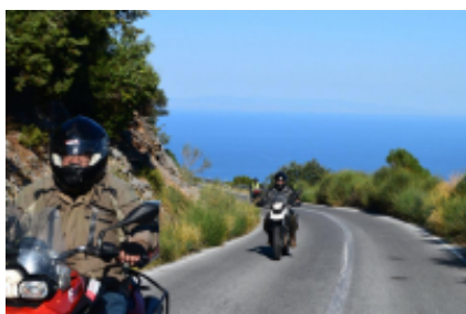
2 - Salónica - Platamon - 184