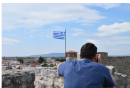
5 - Atenas - Atenas - 0