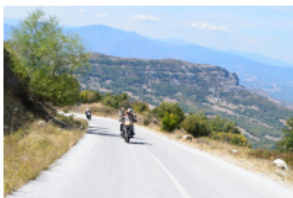
1 - Aeropuerto Internacional de Tesalónica-Macedonia - Salónica - 30