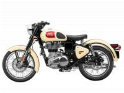
Tan 350 + $0.00