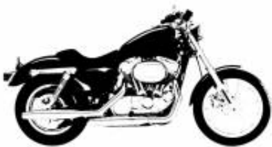
Heritage Softail Cruiser Touring Class + $0.00