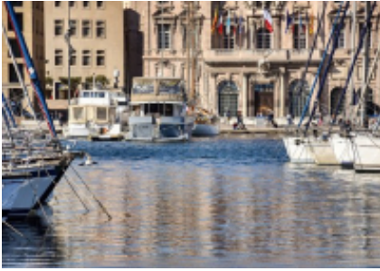
animada costa de la ciudad de las estrellas: Saint-Tropez. Noche cerca del aeropuerto de Marsella.