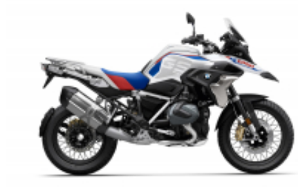
R 1250 GS + $339.11