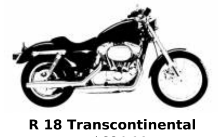
R 18 Transcontinental + $684.11