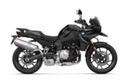
F 750 GS + $0.00