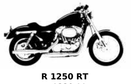
R 1250 RT + $339.11