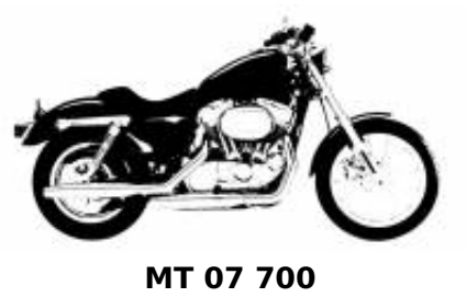
MT 07 700 + $0.00