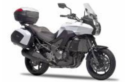
Versys 1000 Grand Tourer + $339.11