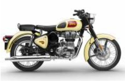
Classic 500 + $58.72