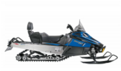
Bearcat XT + $0.00