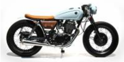
SR 250 Caferacer + $0.00