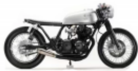
CB 250 Cafe Racer + $0.00