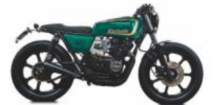
KZ550 Caferacer + $353.52