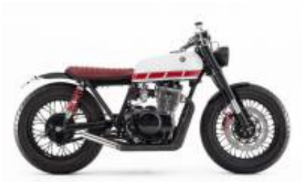
XS 400 + $0.00