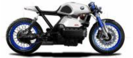
K75 Cafe Racer + $0.00