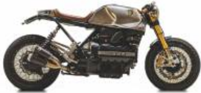
K100 RS Cafe racer + $0.00