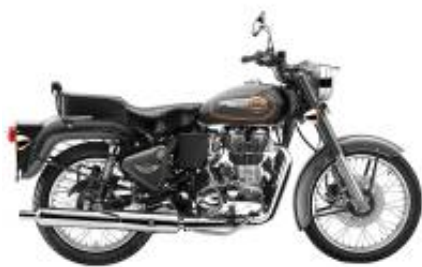
Bullet 500 + $0.00