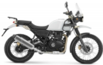
Himalayan 500 + $117.74