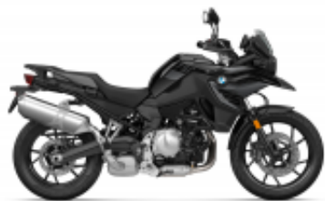
F 750 GS + $2,722.13